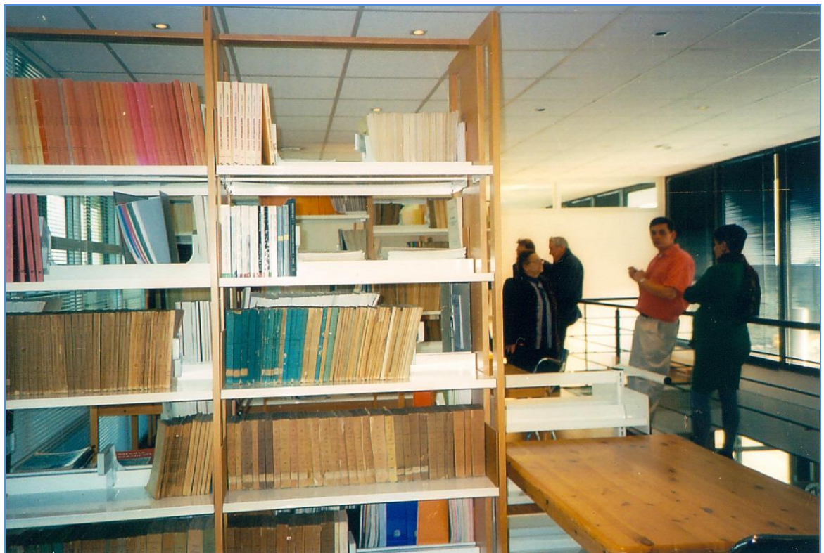
Dans la bibliothèque du Centre laboratoire de Glux-en-Glenne