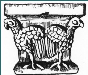
PRIEURÉ SAINT ÉTIENNE XI e S.