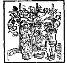
Illustration de CRESCENTHIS (vers 1495)

Site internet : cbehblog.wordpress.com ; courriel : cbeh@wandoo.fr