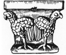
PRIEURÉ SAINT ÉTIENNE XI e S.

Site internet : cbehblog.wordpress.com ; courriel : cbeh@wandoo.fr