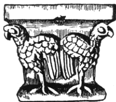
PRIEURÉ SAINT ÉTIENNE XI e S.