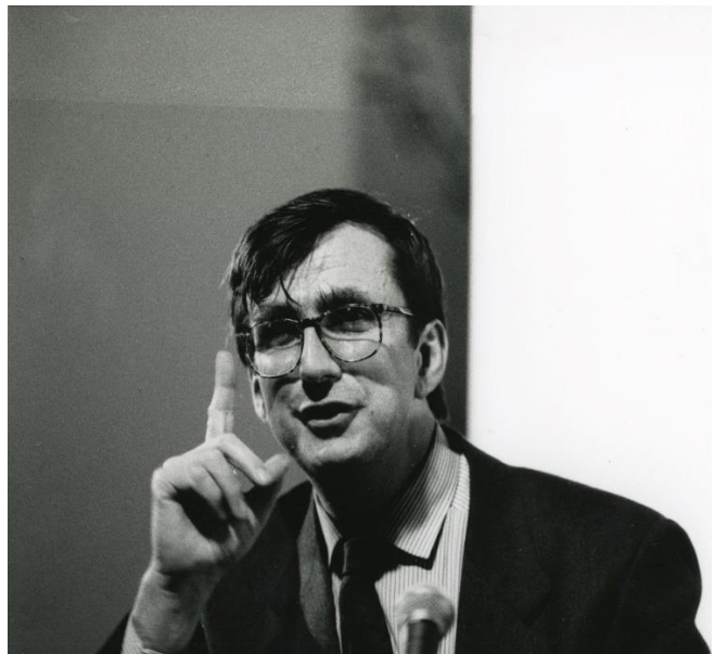
Bruno Latour lors du 25 e anniversaire du Centre de sociologie de l'innovation en septembre 1992

Bruno Latour naît le 22 juin 1947 à Beaune. Il se dit lui-même, je cite « issu d'une famille bourgeoise et provinciale de négociants en vins de Bourgogne. ». Après l'obtention de son CAPES en 1971, puis de son agrégation en philosophie en 1972 à Dijon, Bruno Latour quitte l'Hexagone et devient assistant à la Faculté du Droit d'Abidjan, chargé du cours sur les méthodes en sciences sociales. Il ne cesse ensuite de parcourir le monde, partageant sa carrière d'enseignant-chercheur entre Paris, San Diego, Londres, Harvard, Melbourne, Chicago et Cambridge. De septembre 1987 à septembre 2005, il est responsable du doctorat de la section « Socio-économie de l'Innovation » de l'École des Mines. Il en sort trente-cinq diplômés de doctorat, tous en postes de recherches et d'enseignement en France et à l'étranger.