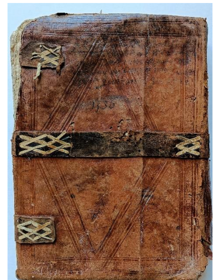
La couverture du registre est d'une bonne facture, preuve de l'importance du document à l'époque.

Nous vous avons déjà parlé dans nos numéros précédents du fonds Violet provenant d'un don Mortureux 1 . Ce classement a permis de repérer certaines pièces de grand intérêt. L'inventaire est sur le point d'être publié. Pourtant il reste quelques manipulations techniques à réaliser. Par exemple, l'un des documents de ce fonds est un magnifique registre de la Justice de Meursault. Il contient toute les affaires traitées par la justice seigneuriale entre 1536 et 1544. Pourtant, ce document passionnant, qui porte encore la cote 124 Z 76, devrait nous quitter pour rejoindre ses petits frères. On trouve en effet, dans l'inventaire des registres de Justice aux Archives départementales de la Côte d'Or, la mention de notre registre parmi d'autres registres de Meursault pour la même période. Aussi, selon le principe de cohérence des fonds, nous procéderons à la réunion de cette petite famille. De même, d'autres pièces, comme des documents de la Mairie de Bligny-les-Beaune rejoindront aussi les fonds du département.