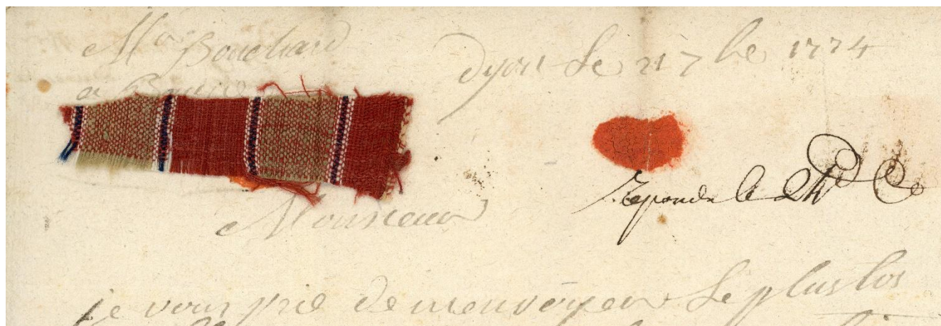
Lettre avec échantillon de tissu adressée à Bouchard, 21 septembre 1774, fonds Bouchard - Archives de Beaune 115 Z 9/1

Ce fonds de correspondance éclaire un pan d'histoire qui n'a finalement jamais été écrit : celui de la fabrication de draps et tissus à Beaune qu'évoquent pourtant les historiens de Beaune comme Gandelot, Courtépée ou Rossignol sans jamais avoir approfondi la question.