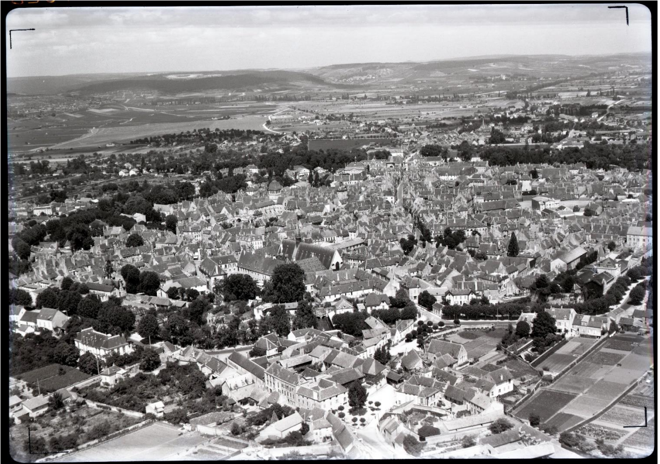
Beaune vers 1957 : dans ses grandes lignes la ville est encore celle de la fin du XIX e siècle comme le montre cette vue aérienne prise à la hauteur du Bd. Saint-Jacques avec en arrière plan les routes de Savigny et de Dijon encore largement champêtres, 13 Fi 9, Archives de Beaune.

L'article est suivi d'un communiqué de l'union locale CFTC qui appelle de ses vœux l'implantation de nouvelles usines permettant de donner du travail aux jeunes du pays beaunois et d'attirer de nouveaux habitants. « Il est vrai, précise la CFTC, que cela peut poser la question du logement qui évolue favorablement, mais n'est pas encore résolue » malgré les efforts accomplis par une « municipalité active et compréhensive comme la nôtre 4 . » Trois jours plus tard, Beaune informations publie un article dans lequel Lucien Perriaux interpelle vigoureusement ses concitoyens : « Il faut que ce pays sorte de la torpeur béate où il se complaît. À quoi bon diront certains ? Ne sommes-nous pas bien tranquilles ? Et pourquoi vouloir tout changer ? Et que pouvons-nous changer ? Je répondrai simplement : d'autres régions, d'autres villes vont de l'avant et du coup vous dégringolez. Que faut-il faire alors ? Soutenir, épauler, tous ceux qui cherchent un remède, qui proposent une solution, qu'ils soient jeunes ou vieux, prolétaires ou capitalistes. Et ne pas imiter les cloportes qui passent leur vie dans la pénombre d'une encoignure de vieille porte. »